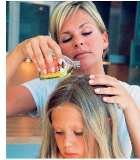
Grundlage erfolgreicher Pressearbeit: In einem Foto-Shooting wurden wichtige Aspekte der Kopflausbehandlung visualisiert: Übertragungswege, Symptomatik, Diagnostik, Therapie und Compliance.

essieren und dabei auch neue inhaltliche Akzente zu setzen. Innerhalb von drei Jahren seit Kampagnenbeginn erhöhten sich die von der Agentur initiierten Veröffentlichungen von anfänglich 7 Millionen (Herbst 2003) auf inzwischen rund 140 Millionen (2006) inklusive Produkt- oder Wirkstoffnennung in Fach- und Publikumsmedien sowie TV. Die Berichterstattung umfasst tagesaktuelle Presse (Die Welt, Tagesspiegel, WAZ, Frankfurter Rundschau), Apothekenkundenzeitschriften (Apotheken-Umschau, Ratgeber aus Ihrer Apotheke), Gesundheits- und Elternzeitschriften (Focus Schule, Ja zum Kind, Kind & Gesundheit, Baby & Familie, Kinder, Gesundheitsbild), Internetportale (Yahoo) und sogar redaktionelle Beiträge in TV-Magazinen wie Focus TV, Visite, Planetopia, Welt der Wunder und Brisant. Im Hinblick auf die eher kritisch eingestellte Zielgruppe der Endverbraucher hat die multimediale Aufklärungsarbeit die Notwendigkeit einer insektiziden Kopflaustherapie und die Vorteile des natürlichen Pyrethrum-Extraktes von Goldgeist forte glaubhaft vermitteln können. Nach einer aktuellen Elternumfrage (IDS/ IMS 2007) würden drei Viertel der Eltern ihre Kinder mit einem insektiziden Wirkstoff behandeln lassen. Damit das auch so bleibt, sind weitere Maßnahmen (wie zum Beispiel das in Kürze startende Webportal www.kopflaus.de ) schon in der Pipeline.